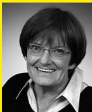
Irmgard Klein Birlenbacher Hütte, Unterer Schießberg