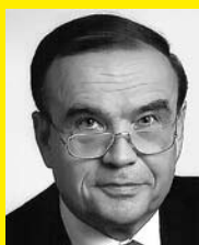
Karl Heinz Gerhards Freiengründer Straße, Richerfeld (Eiserfeld)